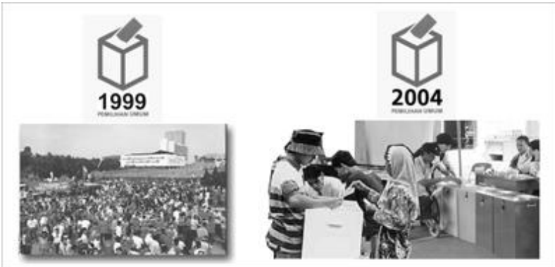
Gambar 1.1. Gambar Pemilu 1999 dan 2004