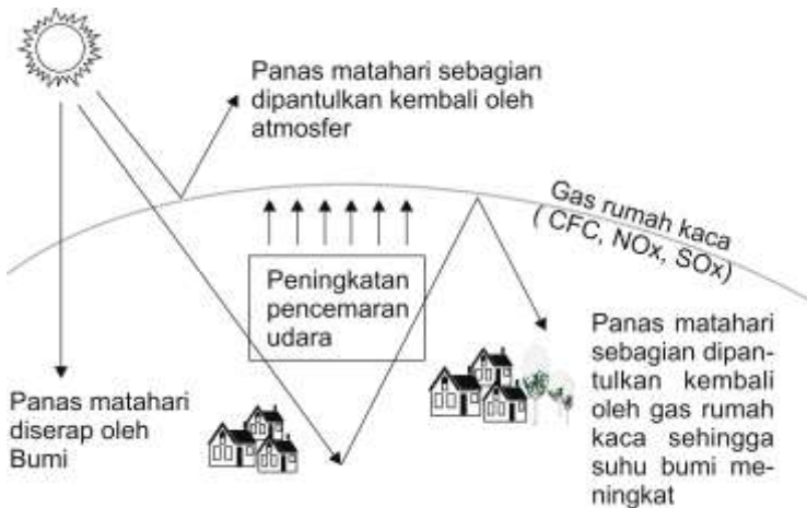
Gambar 1.2. Persoalan Lingkungan Global

Ilustrasi lengkap dari persoalan lingkungan global dapat digambarkan sebagai berikut.