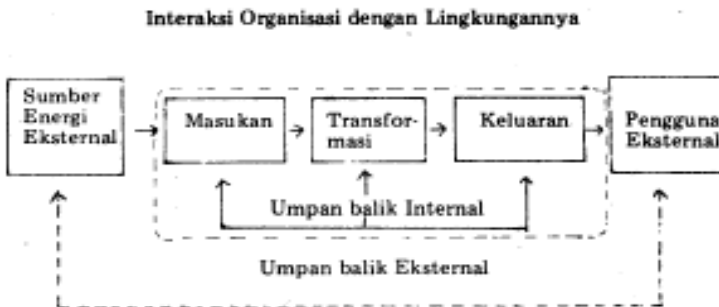
Gambar 1.1 Interaksi Organisasi dan Lingkungan

Respons organisasi terhadap lingkungan, menandakan bahwa sebagai sistem, organisasi berinteraksi dengan lingkungan. Interaksi organisasi dengan lingkungan ini terjadi karena sistem yang berproses tersebut bersifat terbuka. Dikatakan terbuka karena, sebagai suatu sistem organisasi mendapat masukan atau dipengaruhi sumber energi dari lingkungan sekitarnya, misalnya modal, material, informasi, manusia, kekuatan sosial, dan lain sebagainya. Masukan tadi diolah menjadi suatu hasil produksi melalui proses transformasi dan untuk selanjutnya diteruskan sebagai suatu keluaran ( output ) berupa barang atau jasa untuk digunakan oleh pengguna. Para pengguna itu nantinya akan memberikan umpan balik yang dapat berperan sebagai masukan dalam proses selanjutnya. Umpan balik tadi sesungguhnya berperan sebagai suatu mekanisme yang turut mengatur kehidupan suatu organisasi.